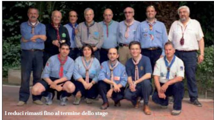
I reduci rimasti fino al termine dello stage

Come «la piccola ghianda seminata a Brownsea» quest'evento ha concretizzato la speranza che il Centro Studi e