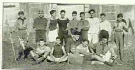
La squadra cadetta della Sezione ARPI.