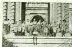
Davanti ad una Chiesa monumentale.