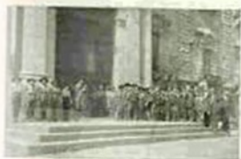
Davanti alla Sede della Sezione. Attorno al D. R.