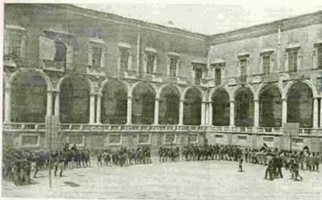
I sei Nuclei sono presentati al Delegato Regionale.

Centro studi e documentazione Agesci Sicilia