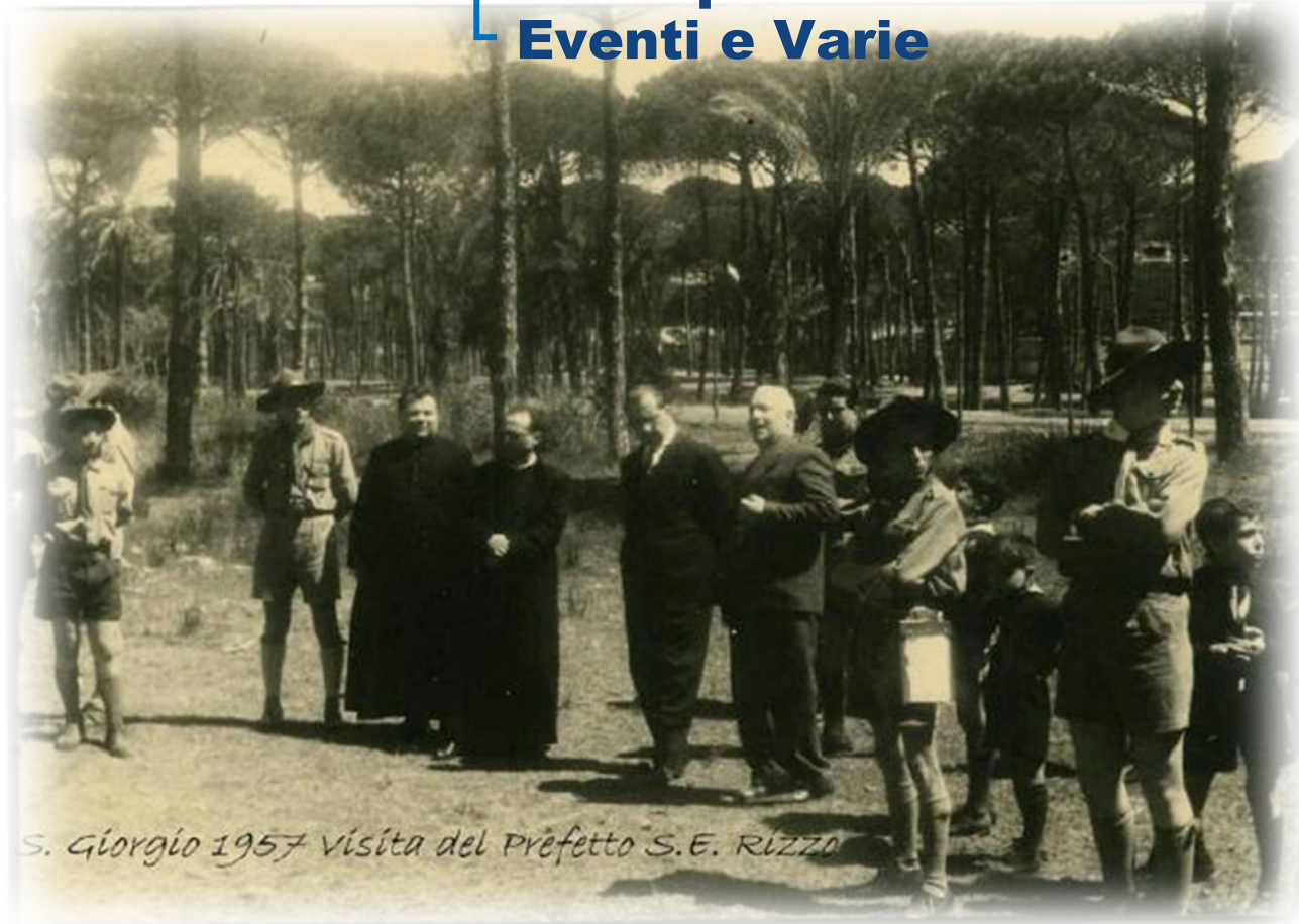
S. Giorgio 1957 visita del Prefetto S.E. Rizzo