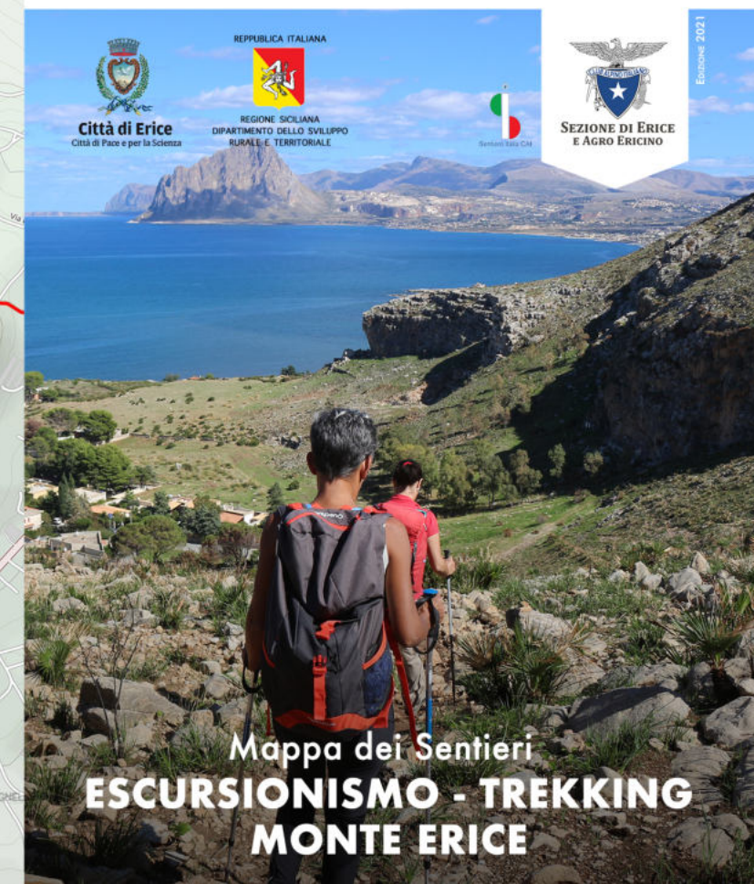
Mapa dei Sentieri ESCURSIONISMO - TREKKING MONTE ERICE